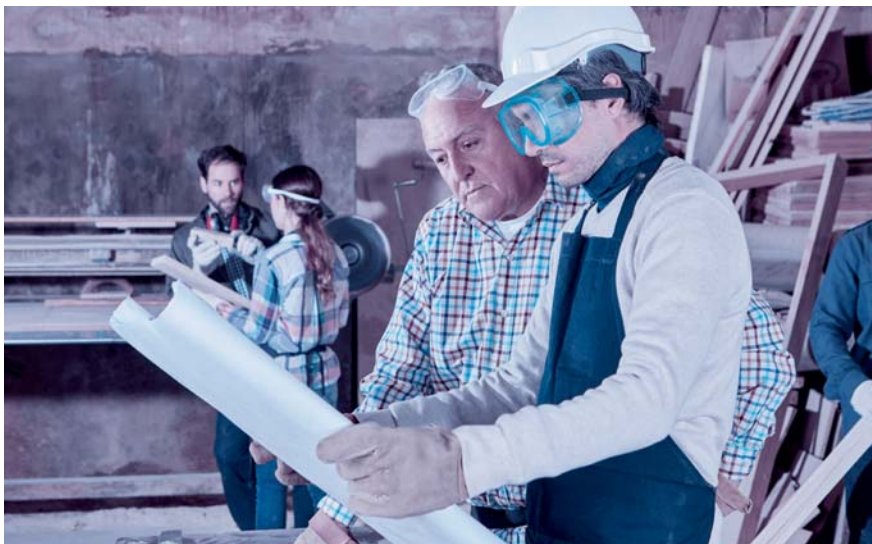
Auch wenn dem Patron etwas zustösst, soll die Firma weiterlaufen.

Wenn die Eheleute keinen ausserordentlichen Güterstand im Rahmen eines Ehevertrags vereinbart haben, gelten die gesetzlichen Bestimmungen der Errungenschaftsbeteiligung. Während jeder Ehegatte sein Eigengut behalten kann – Vermögen, das in die Ehe mitgebracht wurde sowie Erbschaften und Schenkungen –, ist die Errungenschaft, das während der Ehe erworbene Vermögen, hälftig zu teilen. Stellt das Unternehmen Errungenschaft dar, steht dem Ehepartner des Unternehmers grundsätzlich die Hälfte des Nettowerts des Unternehmens zu, insbesondere dann, wenn er während der Ehe dauernd nicht berufstätig war. Hohe Ersatzforderungen können auch entstehen, wenn der Unternehmer aus den laufenden Einnahmen oder aber der Nichtunternehmer aus seinem Eigengut in das Unternehmen investiert hat. Zum Schutz des Unternehmens können Vermögenswerte, die das Unternehmen verkörpern, zu Eigengut erklärt werden.